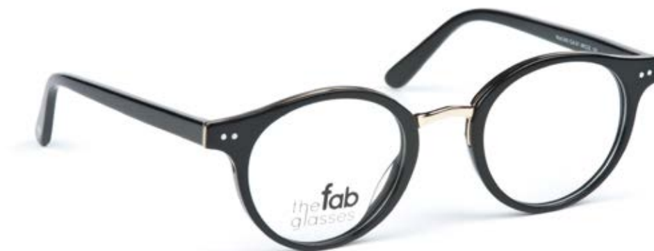
Mod. 345 Col. 01

Col. 02 - Acetato color bordò con finitura lucida, aste dello stesso colore.