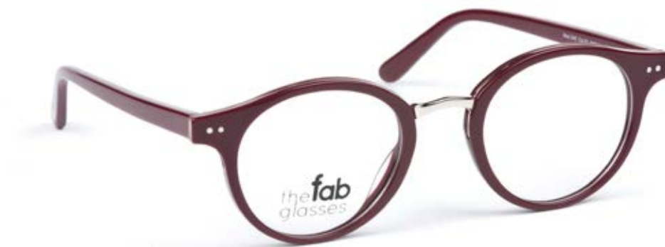
Mod. 345 Col. 02